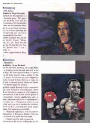
Conté à Paris -1996 Réalisation de fiches techniques sur le crayon de couleur