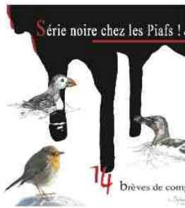
CD à l'écriture un peu décalée... Brèves de comptoirs sur musiques de Jazz - 2016