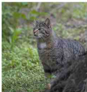
Chat sauvage - Photo prise en Roumanie en 2017