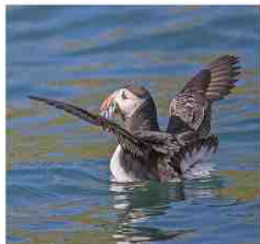
Macareux - Photo prise aux "Sept îles" en 2016