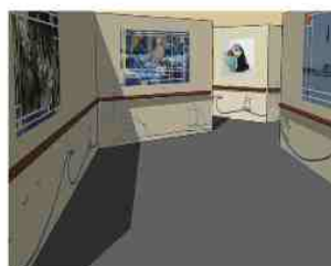
Création de circuits de déambulation pour les personnes âgées désorientées