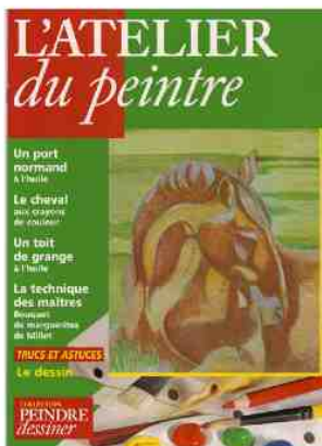
Réalisation de cours pour la revue l'atelier du peintre et les éditions «Larousse» Dessin en couverture....